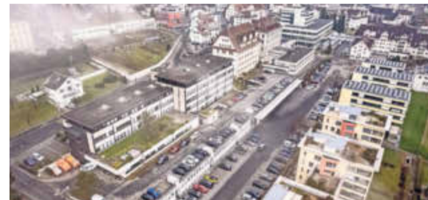
Oben: Der neue Bau soll Regierungsgebäude und Polizeigebäude umarmen. Unten: Das heutige Verwaltungsgebäude an der Bahnhofstrasse.