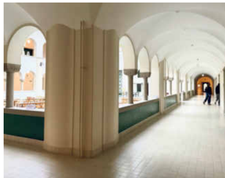
Am Theri in Ingenbohl dürfen bald auch Buben ans Gymnasium.