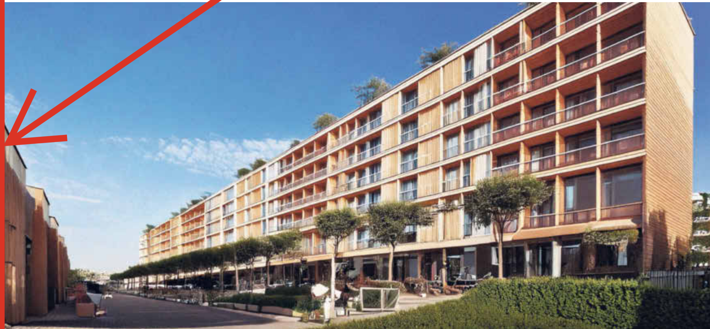
So könnte der Bau an der Schwyzer Bahnhofstrasse beziehungsweise im Oberen Steisteg dereinst aussehen.

Truttmann sagt aber auch: «Andererseits erachten wir diesen Schritt als wichtig, gerade im Hinblick auf die Entwicklung der Gleichstellung.» Die Schule habe über Jahrzehnte hinweg ihre Fähigkeit bewiesen, sich auf die Bedürfnisse der Gesellschaft auszurichten und neue Wege zu gehen. «Wir vertrauen darauf, dass die Schulleitung und die Lehrpersonen die Klassen eng begleiten und dass die persönliche Lehr- und Lernatmosphäre sowie der besondere «Theri-Geist» weiterhin bestehen bleiben.»