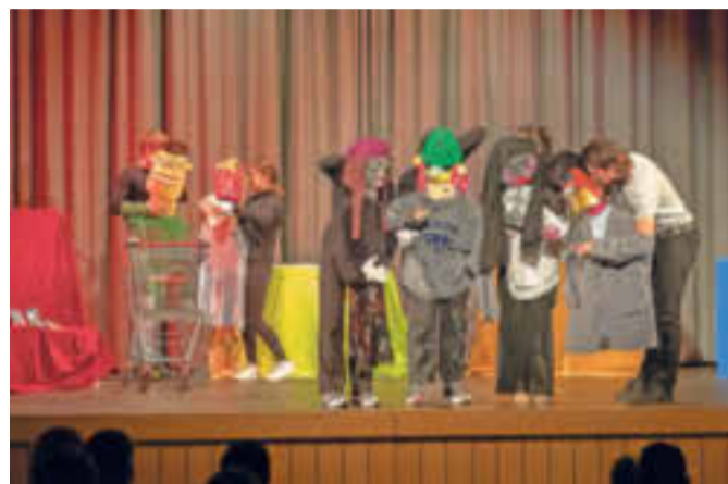
Die Studierenden der FMS 2 hauchten ihren Figuren Leben ein und präsentierten drei temporeiche Geschichten.

Die Teilnahme an den Bühnenprojekten der FMS 2 ist obligatorischer Bestandteil des Unterrichts, und alle Schülerinnen und Schüler der zweiten