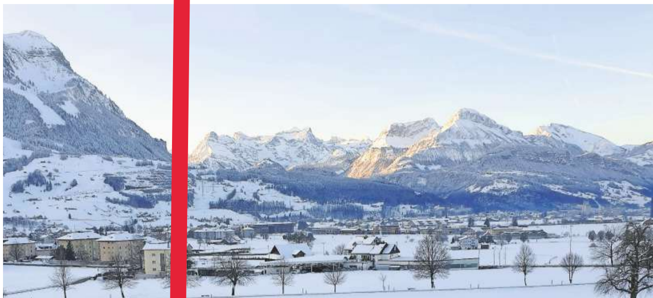
Bereits vor acht Uhr morgens wird der Urirotstock von der Sonne angestrahlt.

Eine Frau nimmt ihren Hund mit in den Zug und erklärt dem Kondukteur: «Ich habe für ihn ein Billett bezahlt. Er hat genauso ein Recht auf einen Platz wie jeder andere Fahrgast. «Selbstverständlich», erwidert der Kondukteur. «Und es ist ihm wie jedem anderen Fahrgast untersagt, die Füsse auf den Sitz zu legen!»