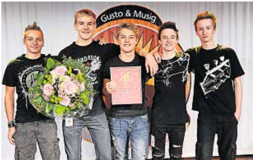
Diese Schwyzer Jungs haben es ins Finale geschafft: die Boygroup Smack aus Freienbach.