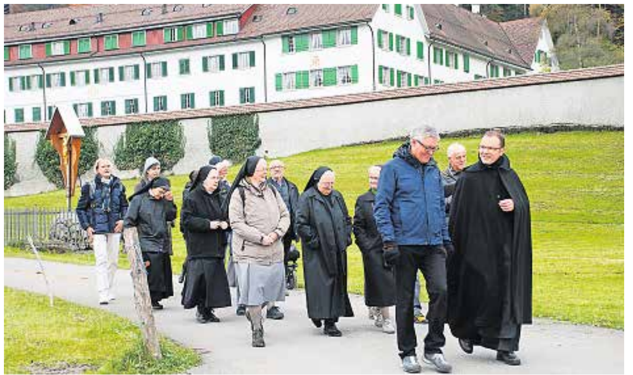
Die Wanderung führte vom Kloster Einsiedeln auf einem Teilstück der «Himmlichen Pfade» zum Kloster in der Au in Trachslau und zurück nach Einsiedeln.